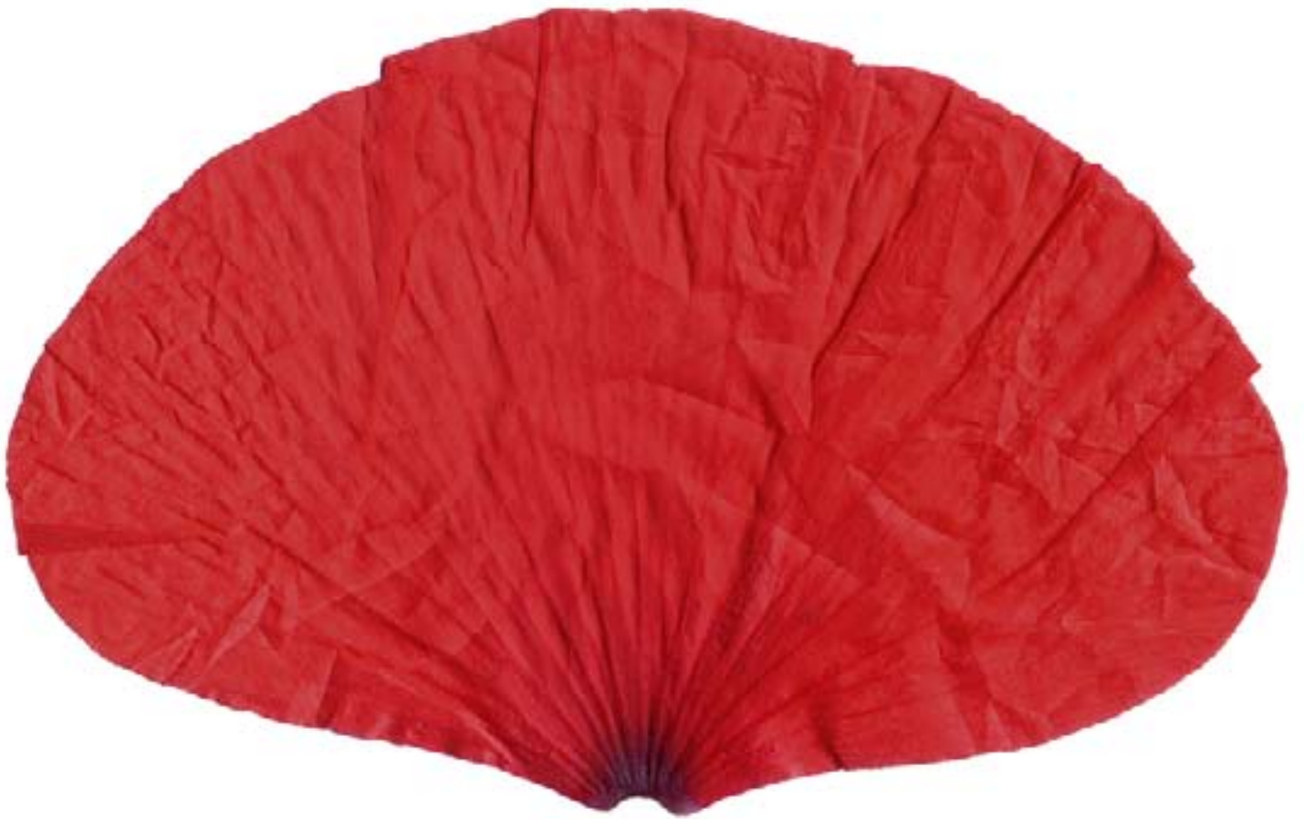
Alexia Creusen, Rouge , impression numérique sur textile, drapeau tiré en plusieurs formats, 2015