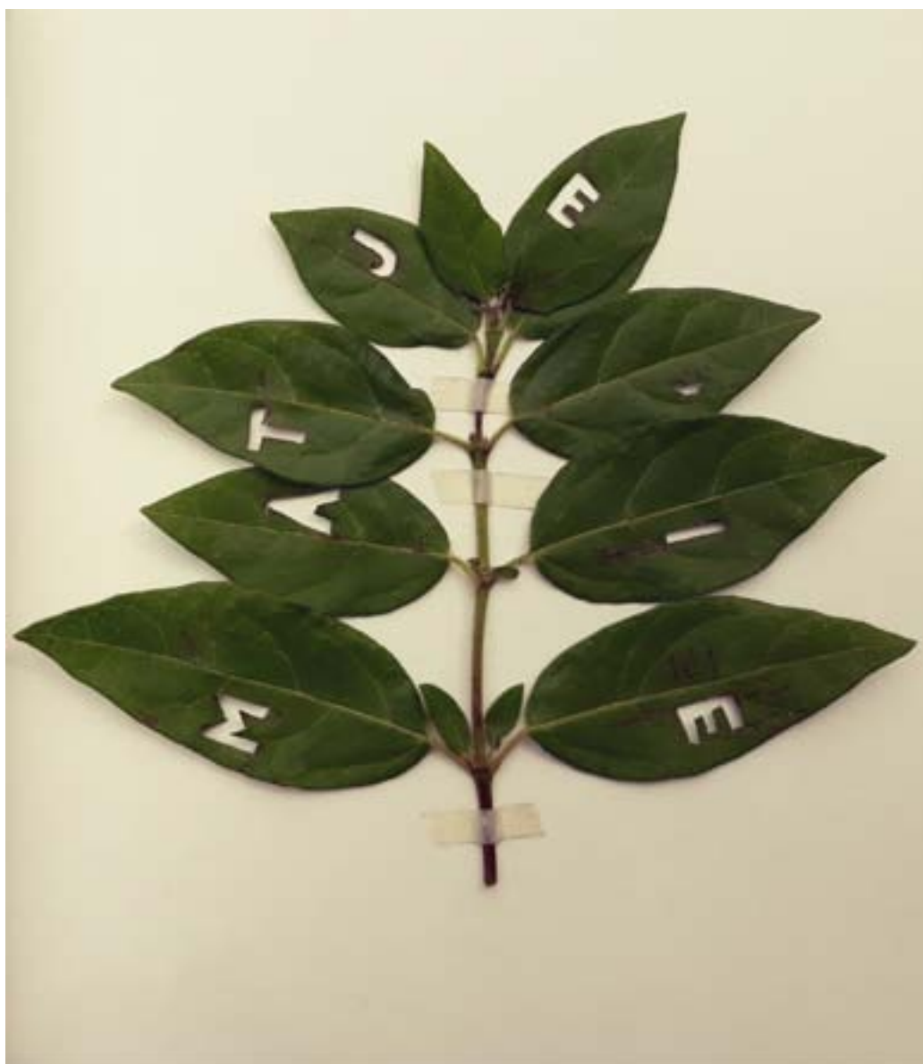
Olivier Pé, sans titre , photographie, 2018

Pour préserver le souffle des cadres ou des enclos qui le tiennent à l'écart de l'ouvert, une poétique du regard, à l'endroit où ça respire, où la réalité dévoile ses pulsations intimes, à la rencontre de ce qui tremble en elle, des forces qui la traversent et en pulvérisent l'image, du désir qui la signifie. Les apparences n'ont pas le dernier mot, elles sont le lieu d'un obscur devenir, l'abri d'une secrète agitation, d'une trouble et chaude nudité qui voudrait se dire mais ne consent à aucune fin.