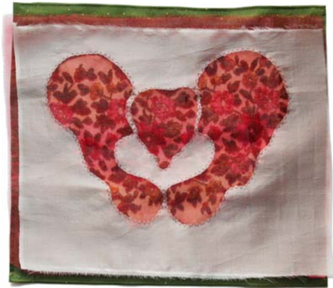
Alexia Creusen, sans titre (bassin fleuri), composition textile, 2009