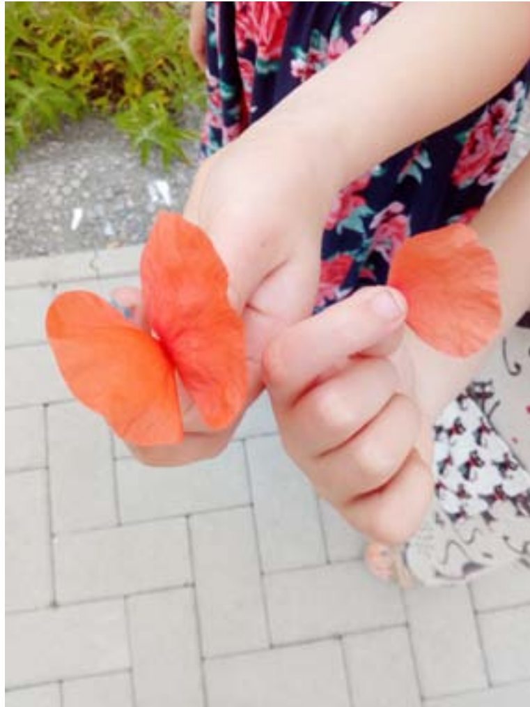
Alexia Creusen, les coquelicots , photographie numérique, 2018