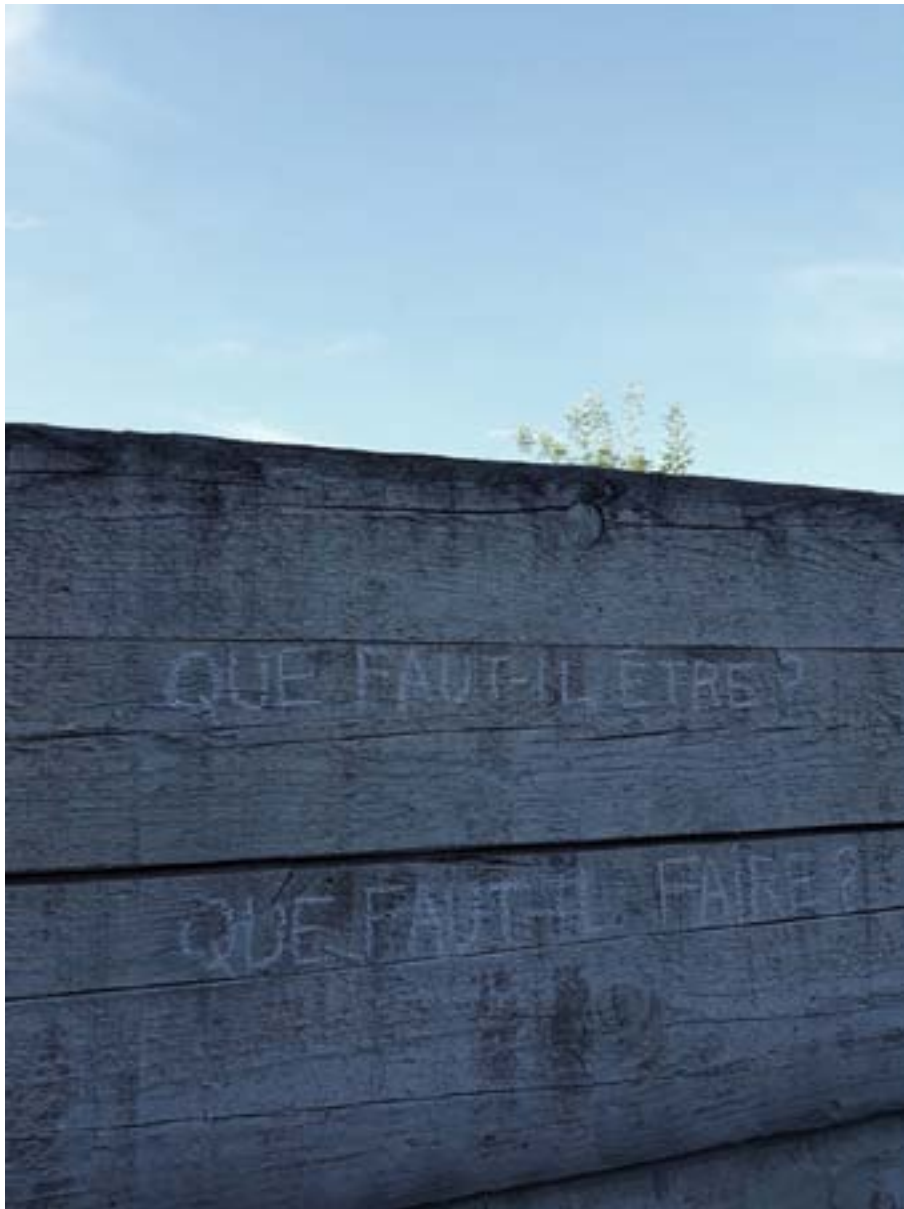
Olivier Pé, sans titre , photographie, 2018