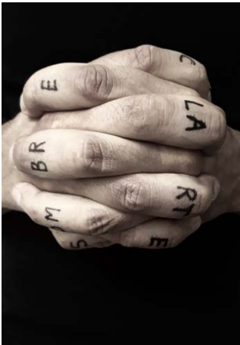
Olivier Pé, sans titre , photographie, 2018