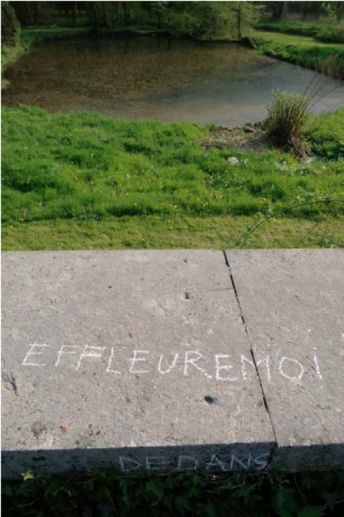
Olivier Pé, sans titre , photographie, 2018