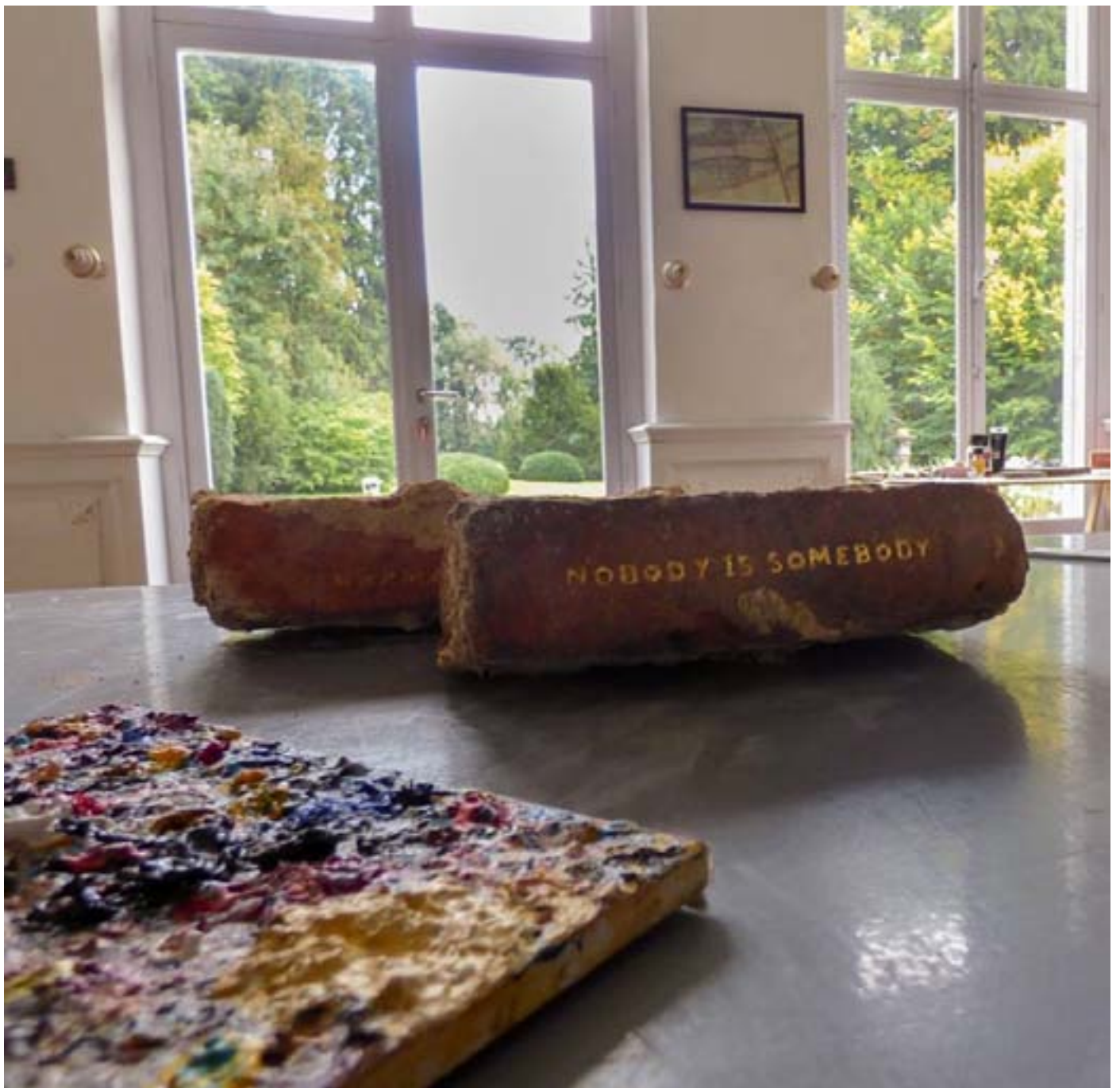
Céline Cuvelier, résidence en 2017